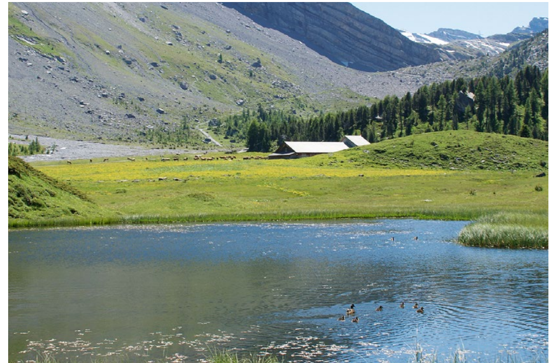
↑ Der ausgetrocknete Arvensee am 27. September 2011 ↓ Spittelmatteesee, Begegnung mit dem Federvieh auf 1875 m ü. M.