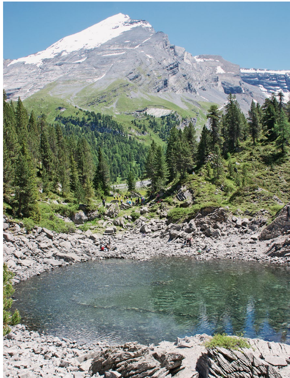
Arvensee im Juni 2011. Im Hintergrund der Atels.

Auf halber Strecke passieren wir am Wegrand immer eine Gedenktafel, die an den Gletschersturz vom 11. September 1895 erinnert, als rund 4,5 Millionen Kubikmeter Eis herunterdonnerten und sechs Menschen unter sich begruben. Über das «9/11» an der Grenze zwischen Bern und Wallis berichtet der Bergsturzforscher Albert Heim in seinem 1896 publizierten Bericht sehr eindrücklich: «Zwischen 04.45 und 05.15 Uhr öffnete sich am Altelsgletscher auf 3340 m ü. M. eine Kluft. Ein rund viereinhalb Millionen Kubikmeter mächtiges Eispaket setzte sich auf der 30 bis 40 Grad geneigten Malmkalkfläche in Bewegung. Auf seiner Talfahrt löste sich das Gletscherstück auf (...) und fuhr bald in rasender Eile über die steile Felsplatte. Die Geschwindigkeit soll gegen Ende der Talfahrt 120 m/sek. oder 430 km/h betragen haben. Bei der nur schwach geneigten Terrasse von Tatelen auf 2275 m ü. M. schoss die Eismasse wie über eine Sprungschanze und, ohne den Hangfuss zu berühren, durch die Luft in Richtung des gegenüberliegenden Üschenengrats. Dort, am steilen Gegenhang, brandete sie rund 320 m hoch auf, bevor sie